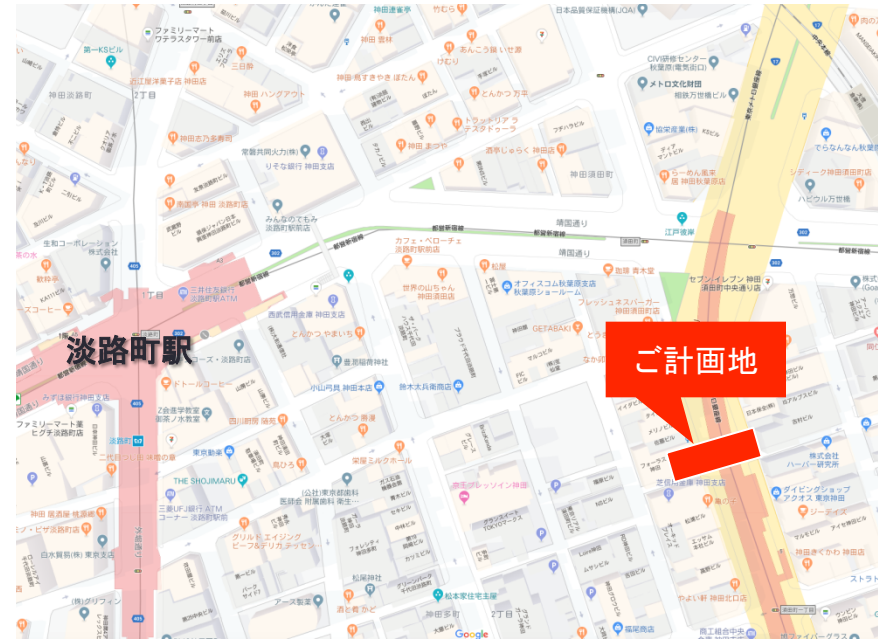
ご計画地:千代田区神田須田町1-16