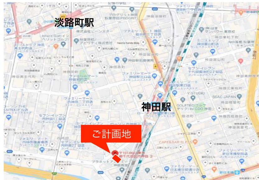
ご計画地: 千代田区内神田3-2-12